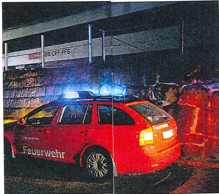
Ein Schlag liess eine Achse des hintersten Zugwagens entgleisen